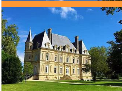
Table d'Hôte - Château Rousseau de Sipian